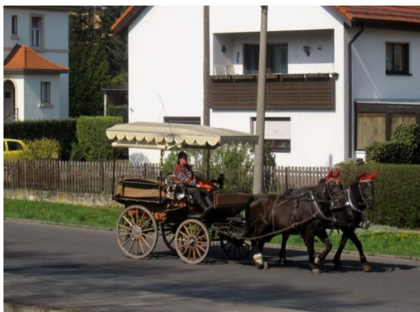
Vozka je řidič

Účastníkem provozu na pozemních komunikacích je tedy především osoba, která řídí motorové nebo nemotorové vozidlo anebo tramvaj, spolujezdec, chodec, jezdec na zvířeti, vozka, průvodce vedených nebo hnaných zvířat, osoba přibraná k zajištění bezpečnosti provozu na pozemních komunikacích apod. (BUŠTA, P., KNĚŽÍNEK, J., SEIDL, A.: Praha 2013, s. 9).