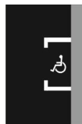
V 10f Vyhrazené parkoviště pro vozidlo přepravující osobu těžce postiženou nebo osobu těžce pohybově postiženou