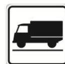
E 9 Druh vozidla