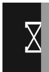
V 10e Vyhrazené parkoviště