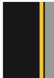
V 12c Zákaz zastavení