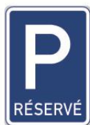
IP 12 Vyhrazené parkoviště