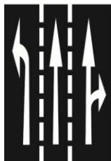
V 9a Směrové šipky