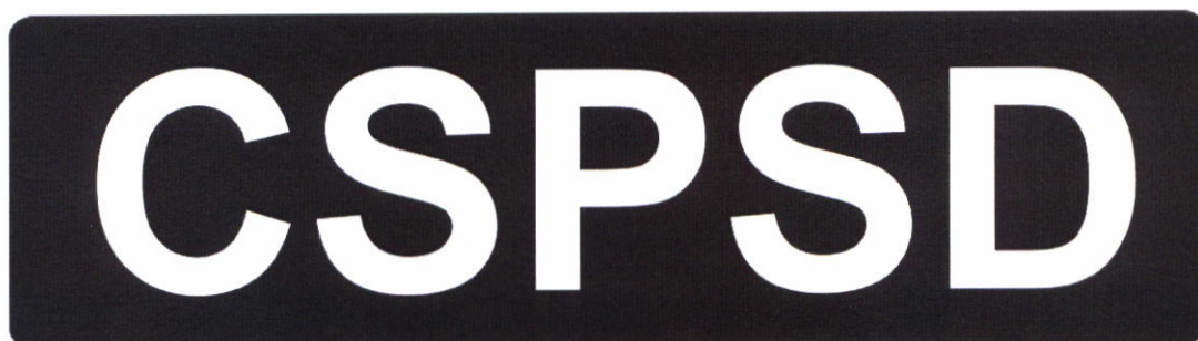
Označení CSPSD na zádech, reflexní provedení na černém oblečení.