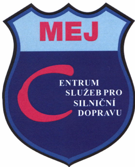
Logo MEJ – velké