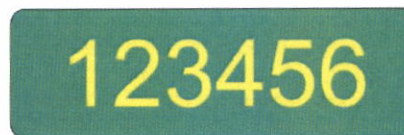
Označení osobním číslem provedení reflexní oblečení