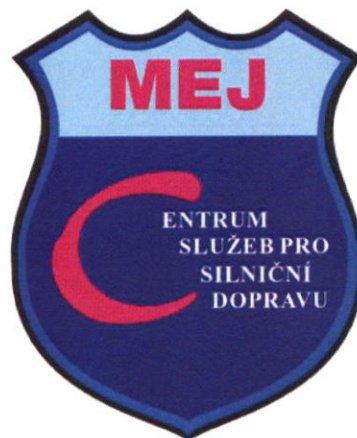
Logo MEJ – malé výšivka na: Polokošile KR černá Polokošile Bavlněná košile černá KR Bavlněná košile černá DR