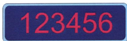
Označení osobním číslem provedení na černé oblečení (suchý zip)