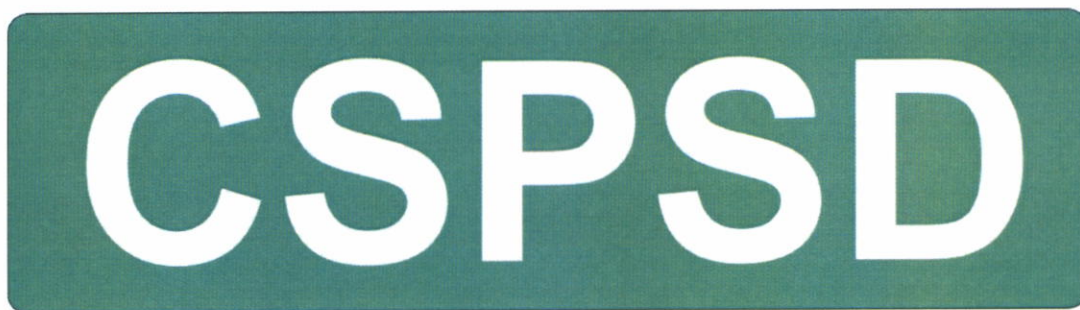
Označení CSPSD na zádech, reflexní provedení na reflexním oblečení.