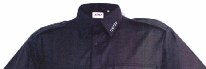
Detail provedení bavlněné košile.