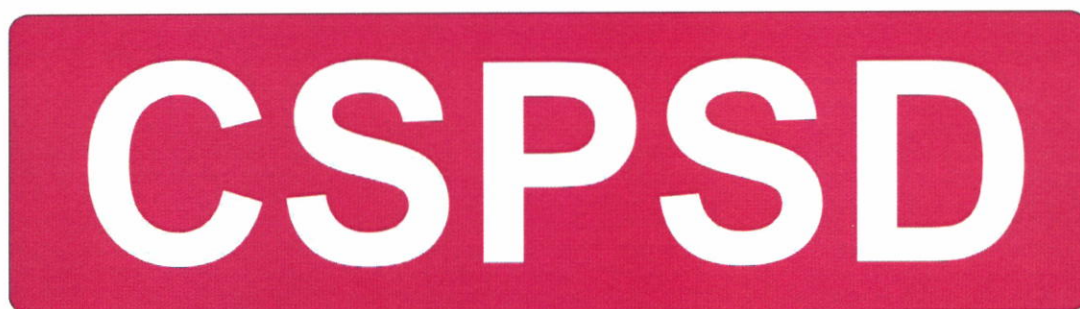
Označení CSPSD na zádech, reflexní provedení na kombinéze jednoduché.